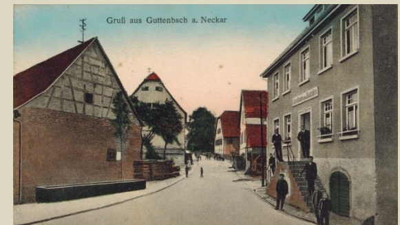
Rechts im Bild: der „Karpfen“ in Guttenbach

Zusammen mit seiner Familie residierte er im Gasthaus „Karpfen“ in Guttenbach. Von dort befehligte er sämtliche noch existierenden Außenlager des KZ Natzweiler.