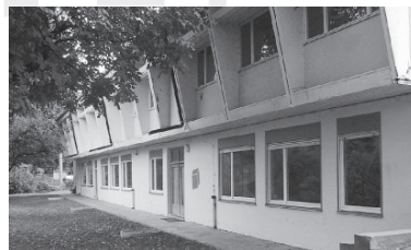
Comenius-Schule von Westen, Elzseite, 2008

Mit viel Arbeit und Kreativität lässt sich daraus ein ungewöhnliches Museum machen. Den Plan dazu gibt es längst. Stadt Mosbach und Verein wirken zusammen. Baubeginn soll in den Sommerferien 2010 sein.